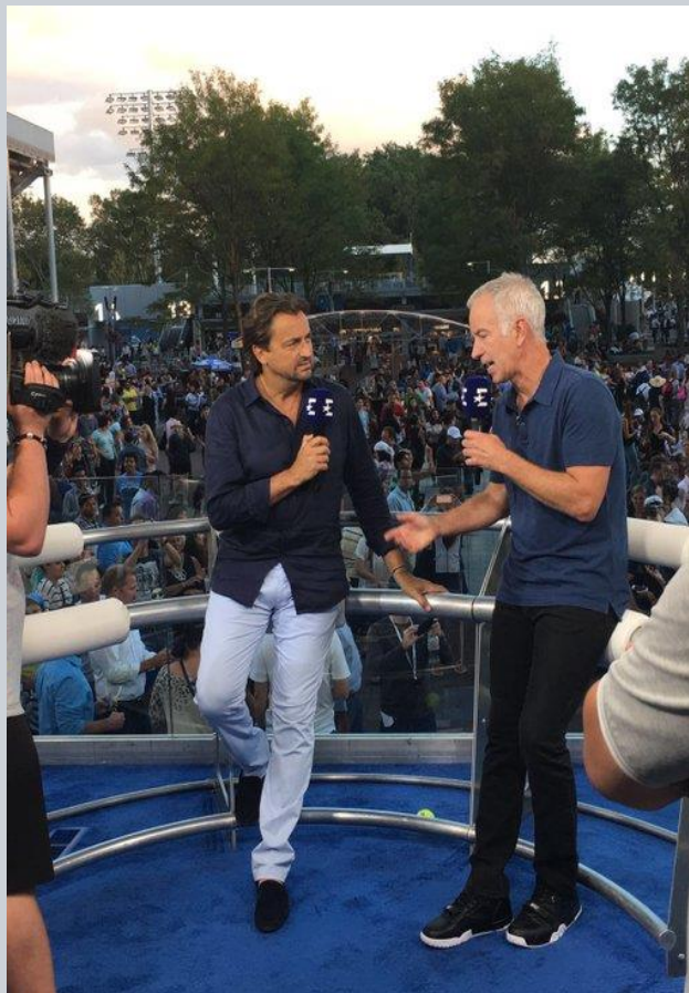
US Open avec John McEnroe

Il a sa propre émission « Avantage Leconte » jusqu'en 2018.